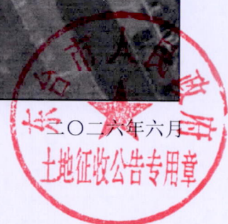
拟征收土地位置示意图