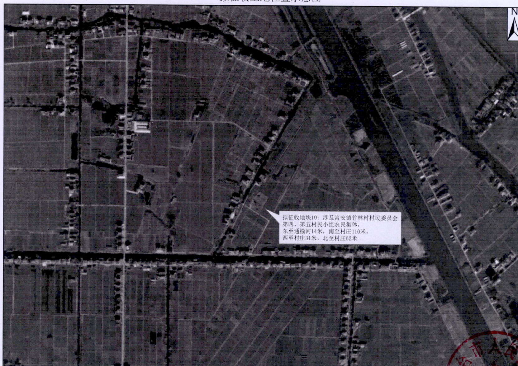
拟征收土地位置示意图

拟征收地块10：涉及富安镇竹林村民委员会第四、第五村民小组农民集体，东至通榆河14米，南至村庄110米，西至村庄31米，北至村庄62米